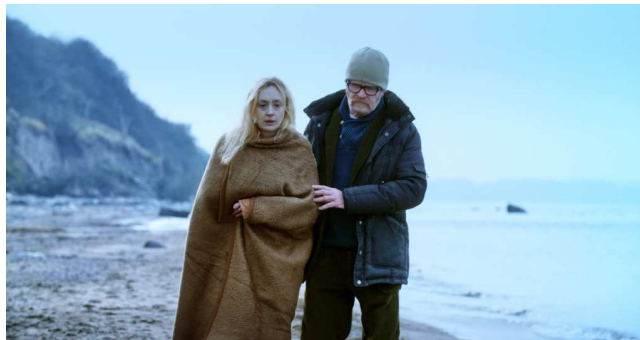
artspring 2019_artspring nale-Videoprogramm_Videoarbeit COLONNA -Standbild-, 2018, Berthold Bock

Der Mai läutet die Festivalsaison ein. Bei artspring kann die Öffentlichkeit endlich Pankows Kunstszene erkunden und die Kunstbuchmesse Miss Read widmet sich in diesem Jahr thematisch der Kultur Skandinaviens. Währenddessen findet in der panke.gallery eine künstlerische Auseinandersetzung zum Datensicherheitsdiskurs statt.